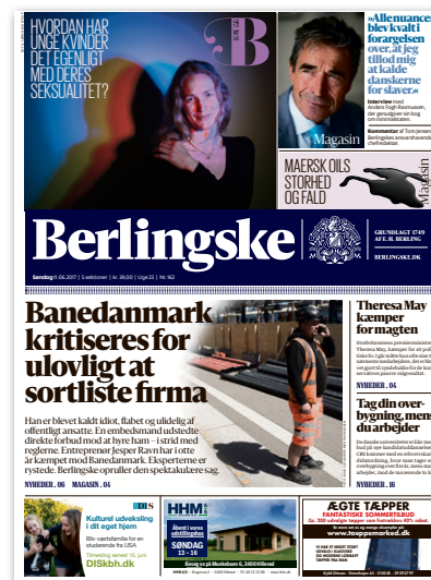
Berlingskes forside 11. juni 2017.